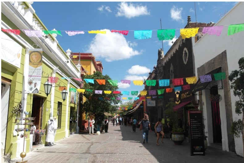
Tlaquepaque, Stadtteil Guadalajaras

„Guadalajara bietet die Möglichkeit sowohl moderne, als auch traditionelle Seiten des Landes hautnah zu erleben. Die Stadt bietet verschiedenste schöne Stadtviertel zum Entspannen und Ausgehen, sowie unzählige Freizeit- und Kulturangebote.