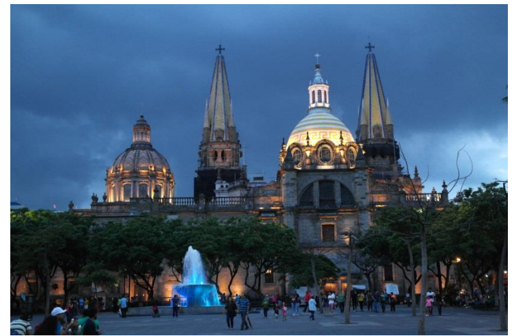
Guadalajara am Abend