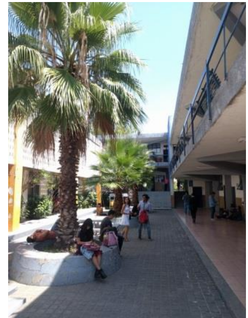
University Center CUCSH der UdeG