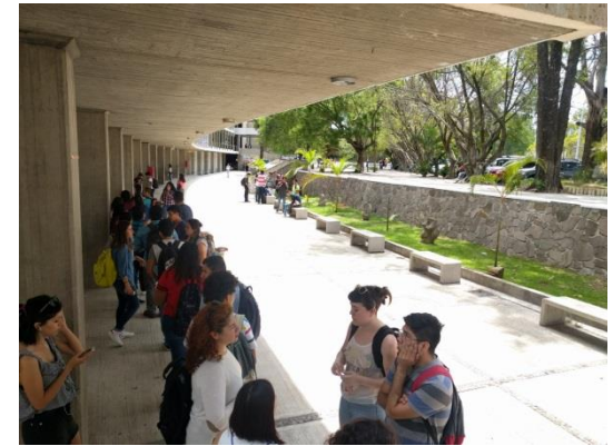
University Center CUAAD der UdeG

„Die UdeG bietet durch ihre enorme Größe eine riesige Kursauswahl mit Kursen, welche sich auch fakultätsübergreifend ohne Probleme kombinieren lassen. Ich konnte so Fächer aus vier verschiedenen Studienrichtungen belegen und wurde in allen Kursen herzlich aufgenommen. Da ich einige interkulturelle Kurse belegt habe, konnte ich viele interessante Einblicke in die mexikanische Kultur erhalten. Mit meinem Kurs "identidad nacional de México" machten wir sogar eine Exkursion auf die Insel Meszcala im südlich gelegenen Chapala See, um eine alte indigene Kultur kennenzulernen.“