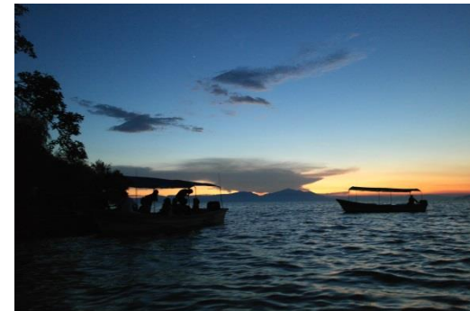
Exkursion auf dem Chapala See

„Die UdeG bietet durch ihre enorme Größe eine riesige Kursauswahl mit Kursen, welche sich auch fakultätsübergreifend ohne Probleme kombinieren lassen. Ich konnte so Fächer aus vier verschiedenen Studienrichtungen belegen und wurde in allen Kursen herzlich aufgenommen. Da ich einige interkulturelle Kurse belegt habe, konnte ich viele interessante Einblicke in die mexikanische Kultur erhalten. Mit meinem Kurs "identidad nacional de México" machten wir sogar eine Exkursion auf die Insel Meszcala im südlich gelegenen Chapala See, um eine alte indigene Kultur kennenzulernen.“