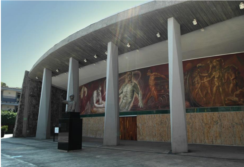
University Center CUCSH der UdeG

Insgesamt 209.466 Studierende studieren an den verschiedenen University Centers der UdeG, die sich in der Metropolregion Guadalajara verteilt befinden. Internationale Studierende dürfen aus sämtlichen Kursen der Universität wählen. Eine vorgeschriebene Mindest- oder Maximalanzahl an ECTS gibt es nicht.